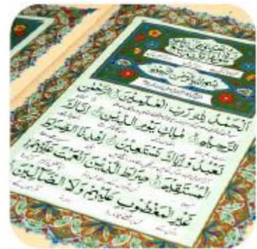
Capítulo Al-Fatihah em Árabe

Este capítulo é recitado como parte das orações diárias dos Muçulmanos espalhados pelo mundo, lembrando-lhes a generosidade de Allah.