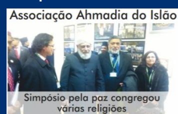
Simpósio pela paz congregou várias religiões

A Comunidade acredita na paz e na tranquilidade e na difusão da mensagem de forma pacífica. O fundador da Comunidade Islâmica Ahmadiã salientou a necessidade de usar a caneta em defesa do Islão. Por isso, a comunidade aproveita plenamente os meios de comunicação sociais, tal como jornais e sítios de internet para defender a sua fé.