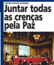
Juntar todas as crenças pela Paz